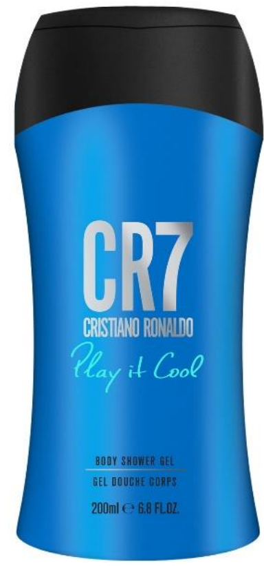
200 ml Shower Gel